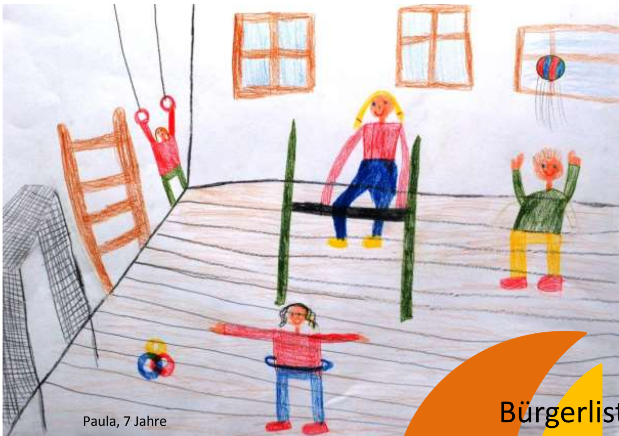
Paula, 7 Jahre